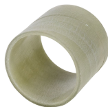
Tuleja SL GRP